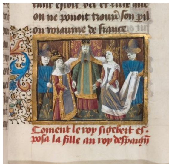
Heirat Sigeberts und Bunehilds